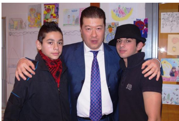
AMARI CENTRUM - FOTOKROUŽEK