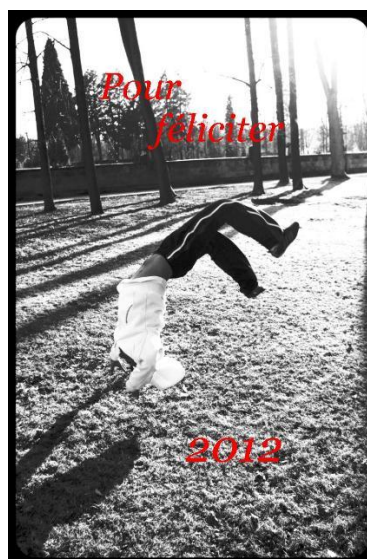
AMARI CENTRUM - FOTOKROUŽEK