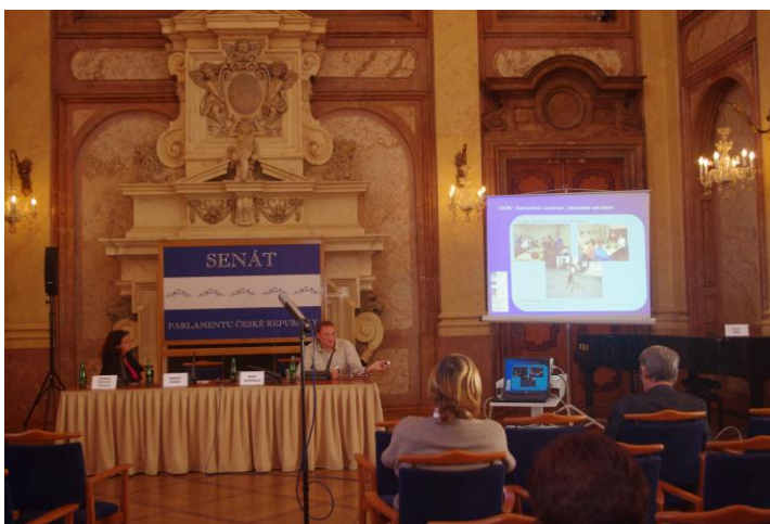
PŘEDNÁŠKA V SENÁTU ČR