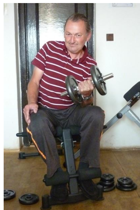
MÁME SVŮJ PLÁN